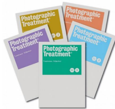
Fotoboeken met tweeluiken