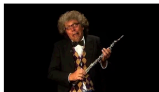
2.2 Instrumentenparade - Familie Hobo 2 years ago