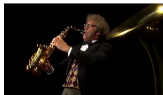
2.4 Instrumentenparade - Familie Saxofoon

Beeldmateriaal van orkesten en instrumenten met uitleg. Zie http://www.lkca.nl/primair-onderwijs/muziek/materiaal-van-het-lkca/video-s-instrumenten .