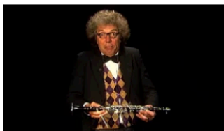
2.3 Instrumentenparade - Familie Klarinet